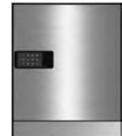
Sサイズ / 電池式