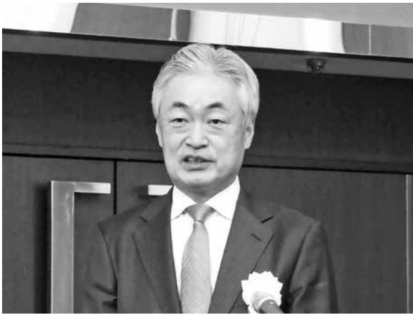
長崎参与閉会挨拶