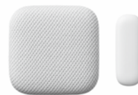
コネクセンサー 温湿度・扉の開閉・帰宅確認を 感知するマルチセンサー