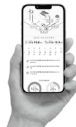
見える化アプリケーション 「ミエネル」