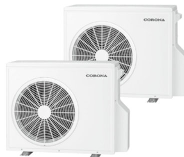
コロナエコ暖システム12.0