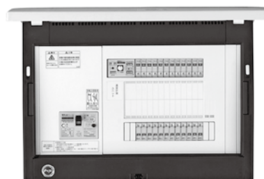
HEMSコントローラクラス enステーション EcoEye